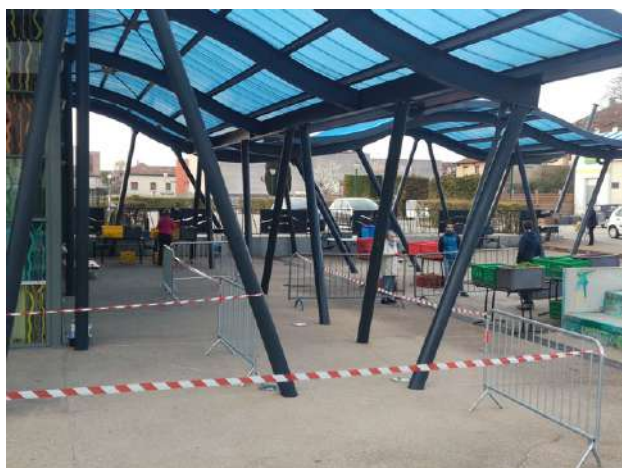
Organisation d'AMAP'Hort, à Ambérieu en Bugey (01)

« Les paysans ont préparé les commandes pour que la distribution soit rapide et sans manipulation » (Amapien des Pieds sur Terre , Lyon)