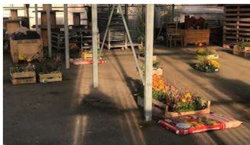
Cagettes horticoles de l'AMAP de l'Ozon, La Talaudière, Loire.