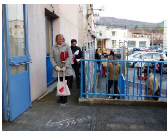
Organisation de l'AMAP du Creux, à St Chamond (42)

« Depuis la semaine dernière, nous avons mis en place une "amap'drive"» (Amapienne de Mines de Liens, Chessy, Rhône)